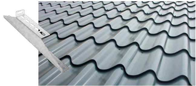
Plåttak med tegelmönster