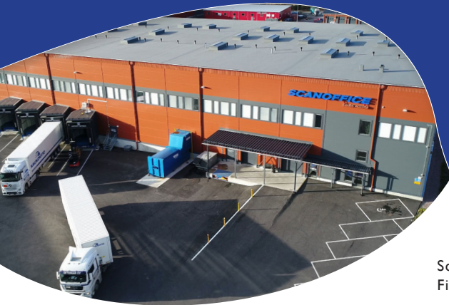
Scanoffice Group:s logistikcenter i Esbo, Finland som blev färdigt 2017

Koncernens logistikcenter i Esbo har ca 6 000 aggregat i lager för att vi ska kunna stäkerställa snabba leveranser till våra återförsäljare.