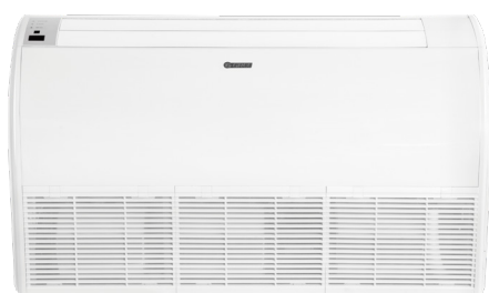
Takhängd inomhusdel 70-A

GREEs avancerade invertertechnik möjliggör en god energieffektivitet. U-match 70-A modellen finns nu med det miljövänliga R32 köldmediet.